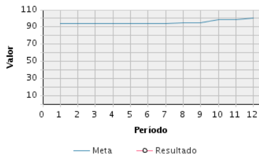
AVANCE FÍSICO PROGRAMADO VS. REAL

Transcurrido: 95.03 % Fecha de Inicio: 24/04/2008 Fecha de Fin: 31/12/2019